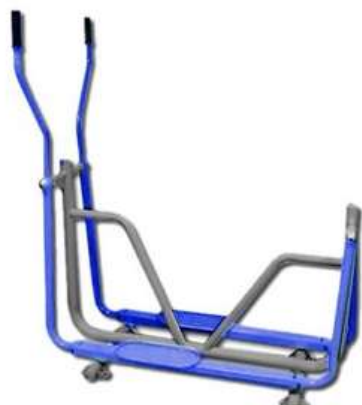
SIMULADOR ESQUÍ CANTIDAD: 1 UNIDAD