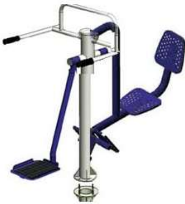
COMBINADO SURF PIERNA CANTIDAD: 1 UNIDAD