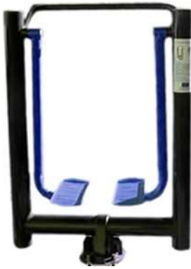
CAMINADOR AÉREO CANTIDAD: 2 UNIDADES