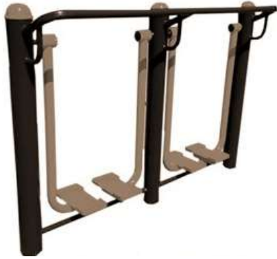
CAMINADOR DOBLE CANTIDAD: 1 UNIDAD