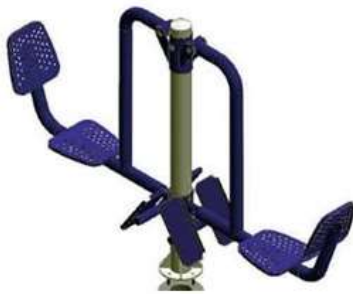
PRESS PIERNAS CANTIDAD: 2 UNIDADES