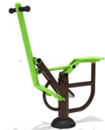
SIMULADOR DE CABALGATA CANTIDAD: 1 UNIDAD