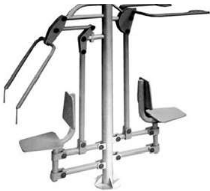
HOMBRO COMBINADO CANTIDAD: 2 UNIDADES