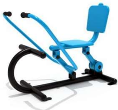
SIMULADOR ESQUÍ CANTIDAD: 2 UNIDADES